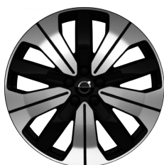
19" 5-Spaaks Black / Diamond Cut