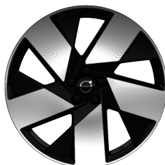
20" 5-Dubbel Spaaks Black / Diamond Cut 1185