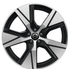
19" 5-Spaaks Black / Diamond Cut