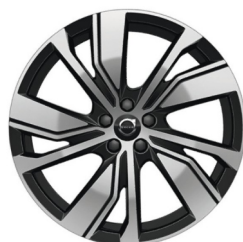
20" 5-Dubbel Spaaks Black / Diamond Cut 1133