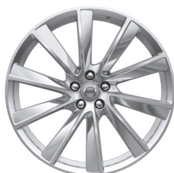
21" 10-Spaaks Turbine Tinted Silver / Diamond Cut 800144