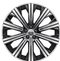
20" 10-Spaaks Black / Diamond Cut Inscription Exclusive

○ Leverbaar tegen meerprijs ■ Leverbaar zonder meer/ minderprijs - Niet leverbaar