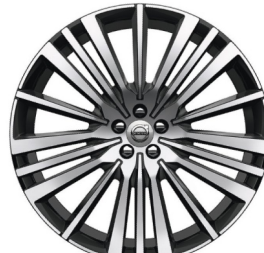
22" 20-Spaaks Diamond Cut / Black 800147