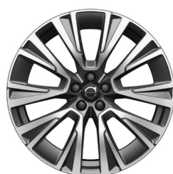
20" 5-Multi Spaaks Diamond Cut / Matt Graphite 1158