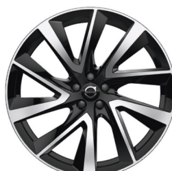
21" 5-V Spaaks Diamond Cut / Matt Black 1014