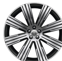
21" 8-Multi Spaaks Diamond Cut / Black 1081