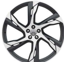
22" 6-Dubbel Spaaks Matt Tech / Black Diamond Cut 800138