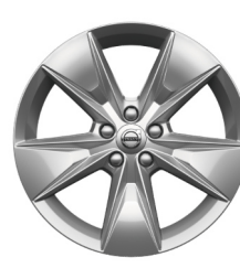
18" 5-Spaaks Silver 1070