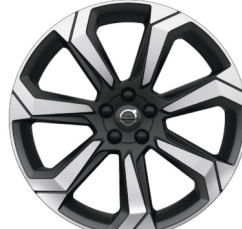
20" 7-Spaaks Matt Graphite / Diamond Cut 800146