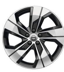
18" 5-Spaaks Black / Diamond Cut Cross Country Pro