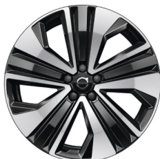
19" 5-Open Spaaks Black / Diamond Cut 1100