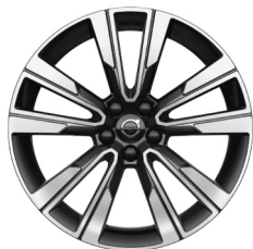
19" 5-Dubbel Spaaks Black / Diamond Cut 1068