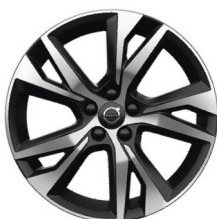
18" 5-Y Spaaks Matt Black / Diamond Cut 1039 R-Design