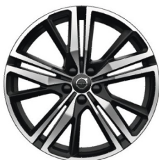
19" 5-Triple Spaaks Matt Black / Diamond Cut 1042