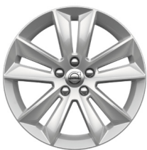
17" 5-Dubbel Spaaks Silver 1035