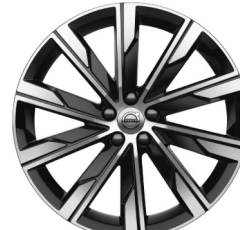
20" 10-Spaaks Turbine Black / Diamond Cut 800145