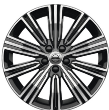
18" 10-Multi Spaaks Black / Diamond Cut 1038 Inscription