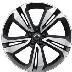
19" 5-Dubbel Spaaks Matt Graphite / Diamond Cut 1067