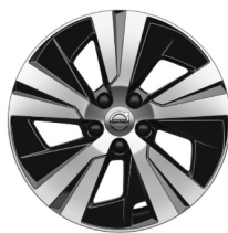
17" 5-Spaaks Black / Diamond Cut 1047