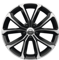
17" 5-V Spaaks Black / Diamond Cut 1036