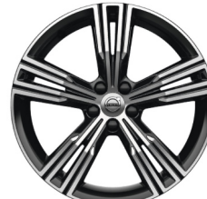
19" 5-Multi Spaaks Black / Diamond Cut 1041