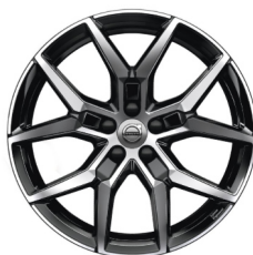
Polestar 19" 5-Y Spaaks Diamond Cut / Black