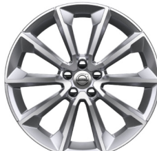
19" 5-V Spaaks Tinted Silver 1040