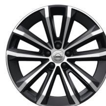
18" 5-Y Spaaks Black / Diamond Cut 1165