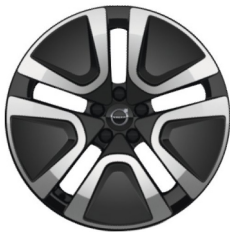
19" 5-Dubbel Aero Spaaks Glossy Black / Diamond Cut 1077