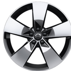
19" 5-Spaaks Black / Diamond Cut 922