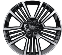
21" 5-Dubbel Spaaks Black / Diamond Cut 800141