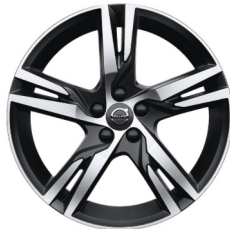
19" 5-Dubbel Spaaks Matt Black / Diamond Cut 911