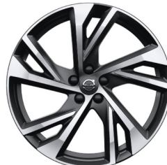
20" 5-Dubbel Spaaks Matt Black / Diamond Cut 920