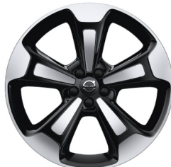
20" 5-Spaaks Black / Diamond Cut 917