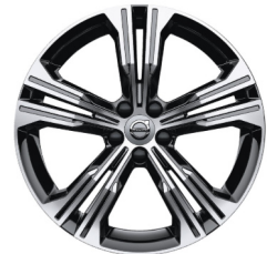
19" 5-Dubbel Spaaks Black / Diamond Cut 924