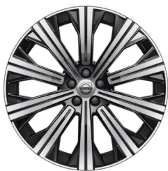
20" 10-Spaaks Black / Diamond Cut - Inscription Exclusive

○ Leverbaar tegen meerprijs ■ Leverbaar zonder meer/ minderprijs - Niet leverbaar